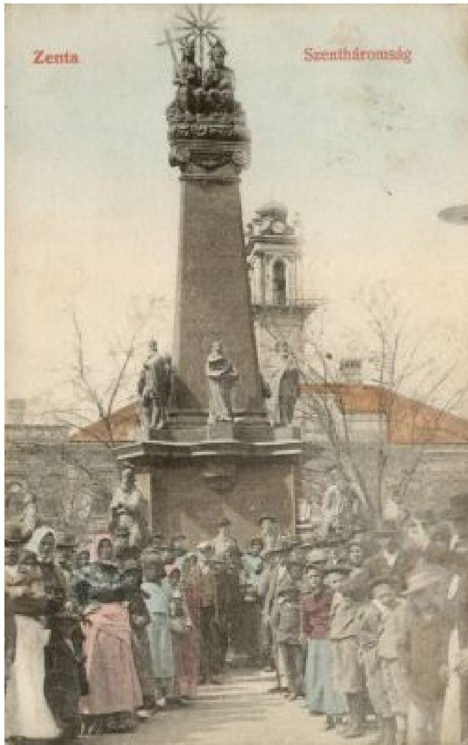
A zentai Szent-háromság szobor