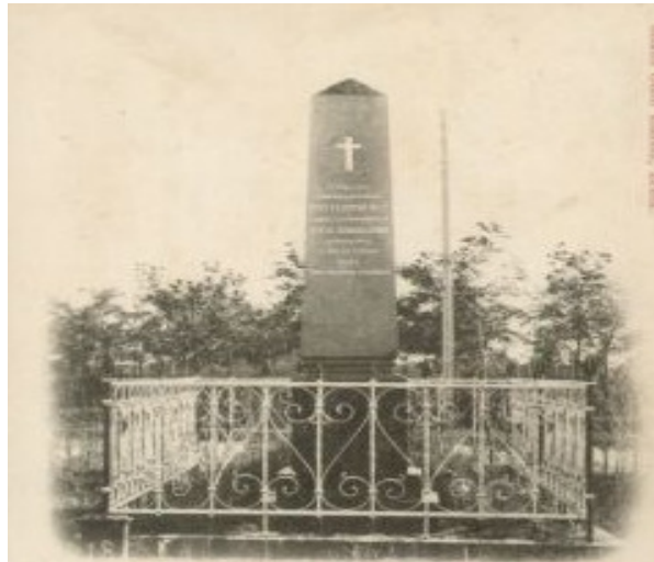
Honvédeknek a belvárosi temetőben.

Kedves kis élelő!' Régi palácok talán léteznek, az népünk között még megmaradtak ne felejtse el senki 2008/12/1 ifj. Károlyi Károly