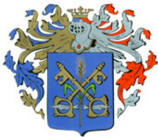
A város címere

Zenta az 1367. és az 1389. években már úgy szerepel a korabeli okiratokban mint a budai káptalan birtoka - révjoggal együtt. A budai káptalan birtokaként fejlődésnek indul. Mint fontos tiszai átkelőhely rövidesen Dél-Magyarország legfontosabb kereskedelmi gócpontjává válik. 1475-ben a szegedi lakosság fegyveres úton elfoglalja a várost - ezzel véve elégtételt - mivel a révjogul rendelkező Zenta vámot vet ki a Szerémségből Szegedre szállított borokra. Ezután a város Szeged tulajdonába kerül. II. Ulászló 1506. február 1-én kiváltságlevelet adott a városnak, így megadta Zentának Szeged minden jogát. A város ekkor címet és pecsétet is kap. E kiváltságlevél fontos állomása Zenta történetének. Szabad királyi városi rangja csakhamar külsejében is kifejezésre jut. Egy-két utcája már európai mércével mérhető.