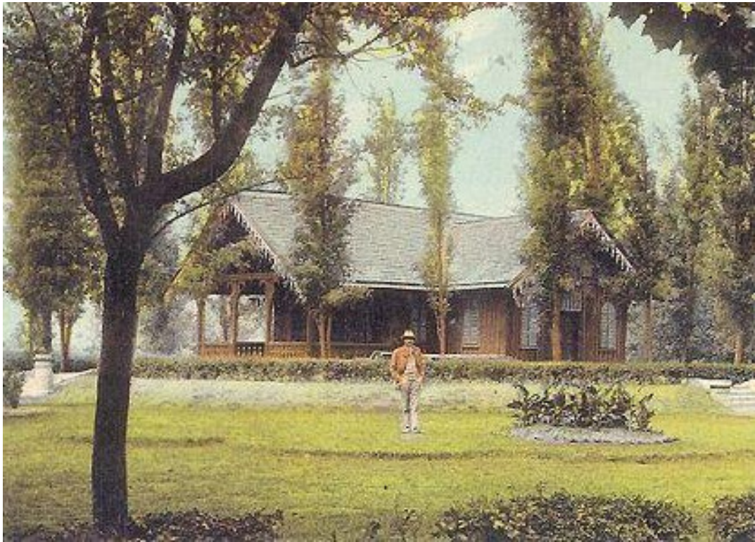
A zentai népkert